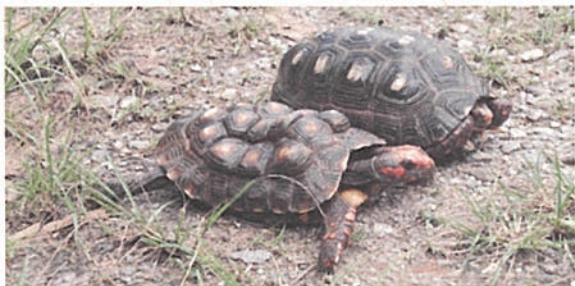
Jabuti deformado por desnutrição