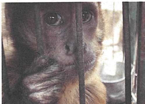
Macaco-prego vítima do tráfico

Não é possível legalizar um animal silvestre que foi capturado na natureza e adquirido de forma ilegal. A aquisição legal é feita em lojas e criadouros autorizados pelo órgão ambiental competente, acompanhada de nota fiscal e marcação individual.