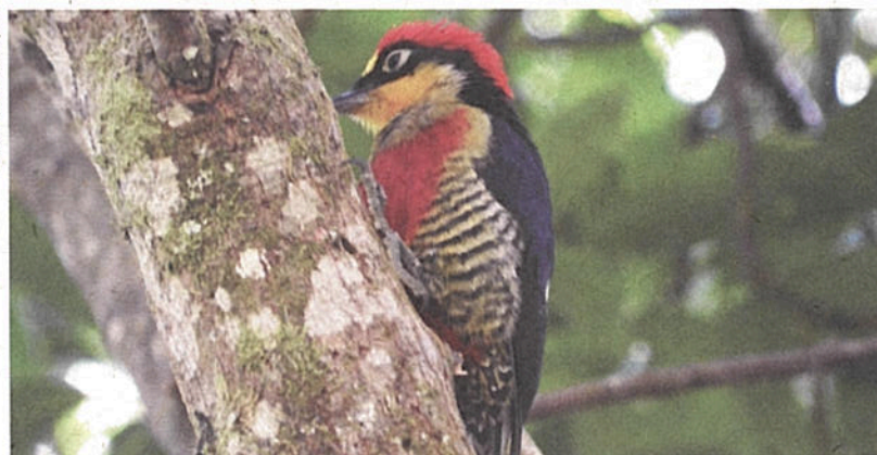
Benedito-de-testa-amarela no Parque Estadual do Desengano - RJ

Visite parques e outras áreas verdes. A natureza é o melhor lugar para se apreciar os animais!